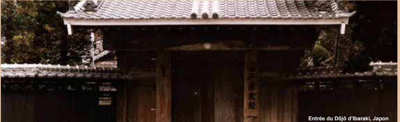
Entrée du Dôjô d'Ibaraki, Japon

Le dôjô est le lieu d'une pratique. Plus que cela, il est l'union d'un homme avec tout une histoire, une philosophie.