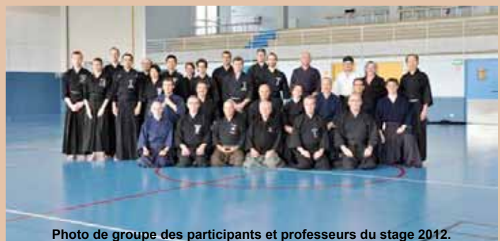
Photo de groupe des participants et professeurs du stage 2012.